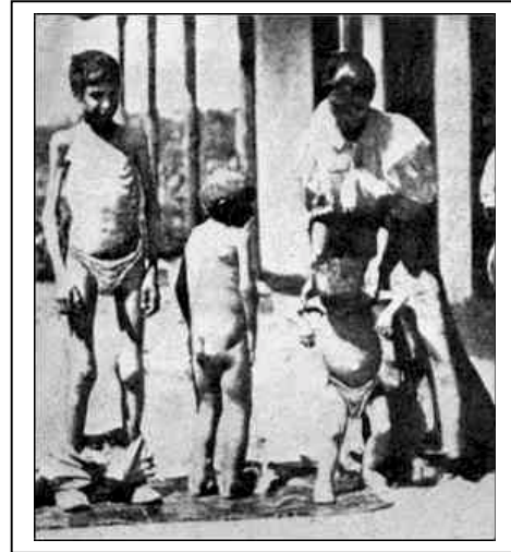
Reconcentrados cubanos (1896-1898)

robadas todas sus propiedades personales, sus casas y sus fincas, despojados de sus animales domésticos y de trabajo y reconcentrados en varios campamentos en Camagüey y Pinar del Río, tal y como lo había hecho Weyler en el siglo anterior. Todavía hoy existen algunos de esos campamentos. Los cómplices y simpatizantes pasados y actuales de la revolución no pueden justificar estos crímenes y actos de lesa humanidad y terrorismo de estado al estilo de los Nazis y de los Estalinistas.