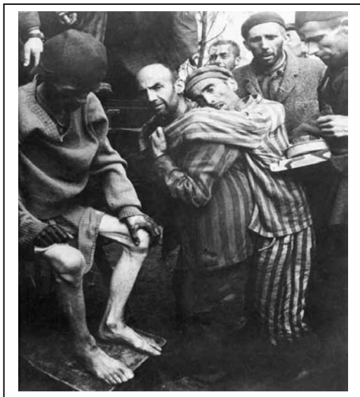
Prisioneros de Auschwitz (1945)

El 27 de enero de 1945 – hace 60 años – tropas soviéticas entraron en Auschwitz. En los próximos días y meses, tropas americanas e inglesas liberarían a los prisioneros sobrevivientes de otros campos. Sin embargo, Auschwitz fue el mas grande, el mas completo campo de concentración y matanza de los nazis, pudiendo considerarse en realidad como un conjunto de tres sub-campos: Auschwitz I, Birkenau y Monowitz. En polaco, Auschwitz se dice “Oswiecim,” y ése es el nombre de la pequeña ciudad mas cercana a los campos. Cracow está como a 40 millas y Varsovia, la capital, como a unas 200 millas al norte.