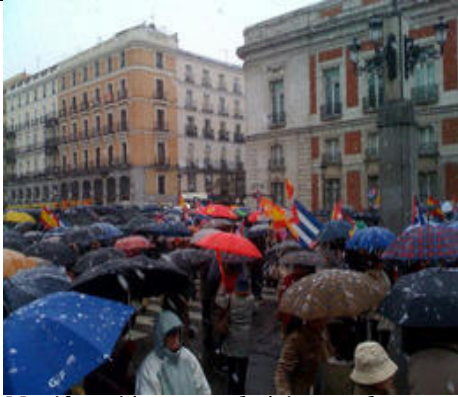
Manifestación contra el régimen cubano en la Puerta del Sol, Madrid, 1 de febrero de 2009.

Bajo una persistente nevada se realizó la manifestación en Madrid contra 50 años de Dictadura en Cuba