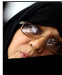
Parvin Ahmadinejad a diferencia de otras mujeres iraníes no se cubre el rostro.