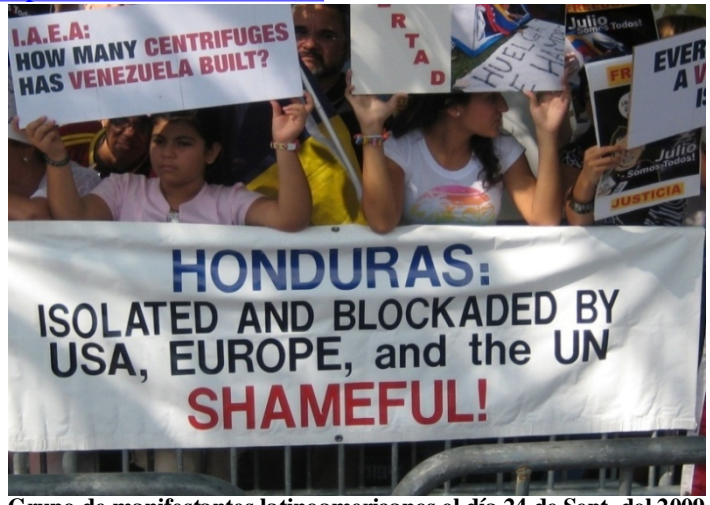
Grupo de manifestantes latinoamericanos el día 24 de Sept. del 2009 en la plaza Dag Hammarskjöld frente a la ONU.