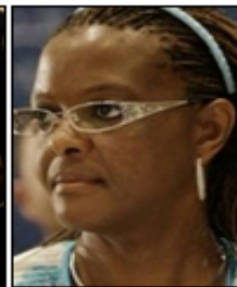
Grace Mugabe conocida como First Shopper o Gucci Grace