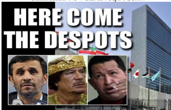
Los dictadores, asesinos sin términos de mandato, terroristas de estado, enemigos de la Democracia y violadores de los Derechos Humanos, hablaron en la apertura de la 64va. sesión de las Naciones Unidas en New York. Solo Honduras fue excluida.