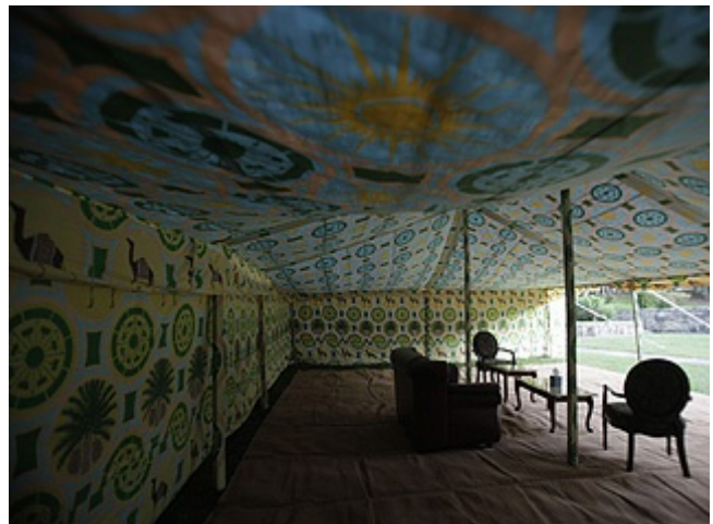
La carpa "beduina" del déspota libio Quadafi, piel de camello, sofás de cuero y mesas de café; prohibida en New Jersey y por dos ocasiones removida de una propiedad de Donald Trump en Bedford, New York.

508-43rd Street. Union City, NJ 07087. Teléfono: 201-8676211