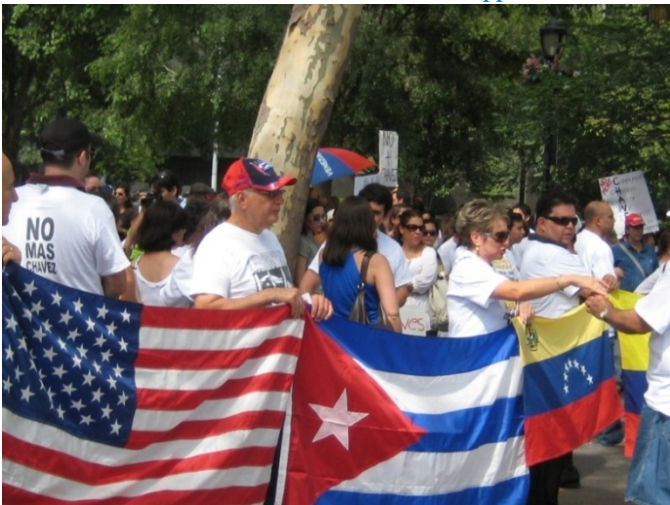
Plaza Dag Hammarskjöld frente a las Naciones Unidas en New York, "Demostración NO + Chávez". Sept. 04, 2009.

WEB: ueppc.com - E-mail: presospoliticoscubanos@msn.com