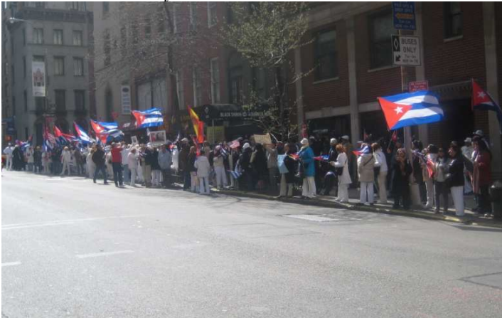
Marzo 27 del 2010: Protesta frente a la Misión diplomática de Cuba ante la ONU, en la ciudad de New York.