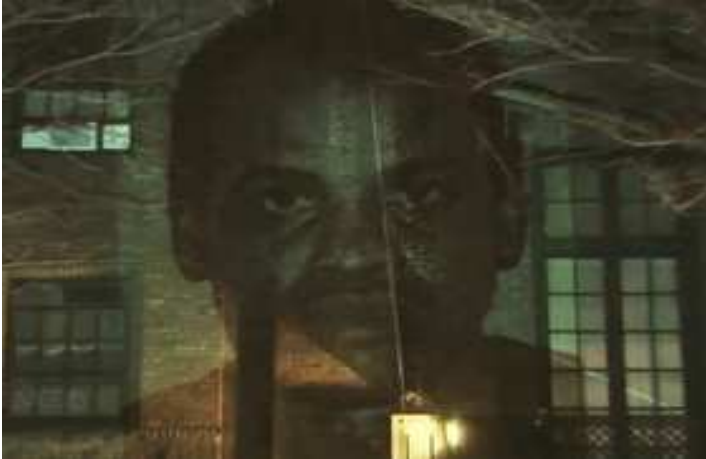
Marzo 18 del 2010: Imagen de Orlando Zapata Tamayo proyectada en la fachada de la Misión diplomática de Cuba ante la ONU en Lexington y la 38 St. en New York. Posteriormente fue llevada también al Consulado de Cuba en Barcelona, España. Obra del pintor cubano exilado Geandy Pavón.