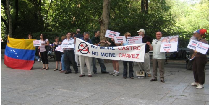
Septiembre 04 del 2010. Parque Central de New York. Demostración NO MAS CASTRO, NO MAS CHAVEZ.