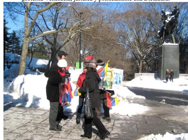
La exigua contra protesta chavista. Al fondo la estatua ecuestre de José Martí a la entrada de Central Park, New York.