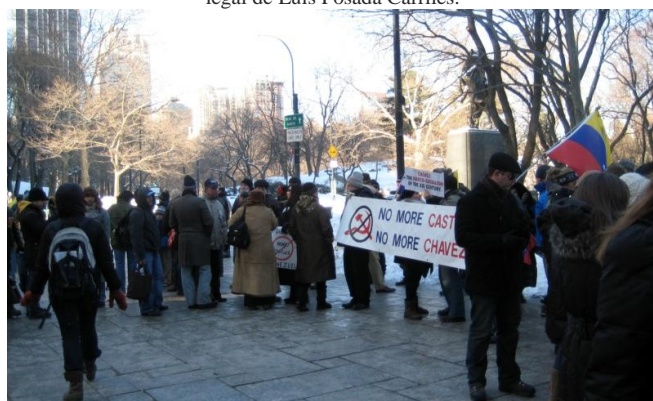
Enero 23 del 2011: En conmemoración del movimiento cívico que derrocó en 1958 la dictadura de Marcos Pérez Jiménez las organizaciones "Un mundo sin mordaza", S.A.V.E. Venezuela, RECIVEX y otras en la protesta de Central Park de New York (entre otras 30 ciudades en el mundo) declarando al régimen que gobierna Venezuela, jurídica y políticamente una Dictadura.