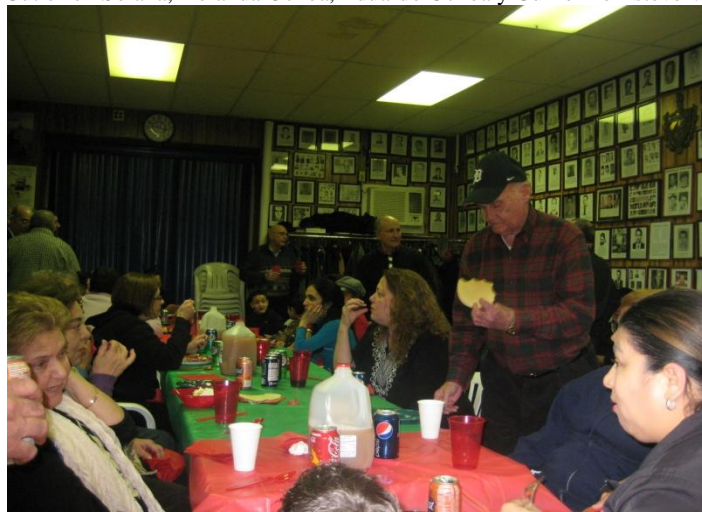
Diciembre 21 del 2010: Comida informal de fin de año organizada entre los que asisten regularmente los martes a las reuniones del Ejecutivo.