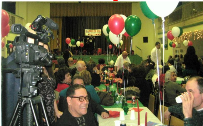
Diciembre 04 del 2010: Comida anual de la UEPPC y entrega de Certificados de Colaboración y "Orden Unidos por Cuba"; en el Hudson Hall de West New York, NJ. En el escenario una foto del preso político cubano Dr. Oscar Elías Biscet, flanqueada por las banderas de EE.UU. y Cuba.