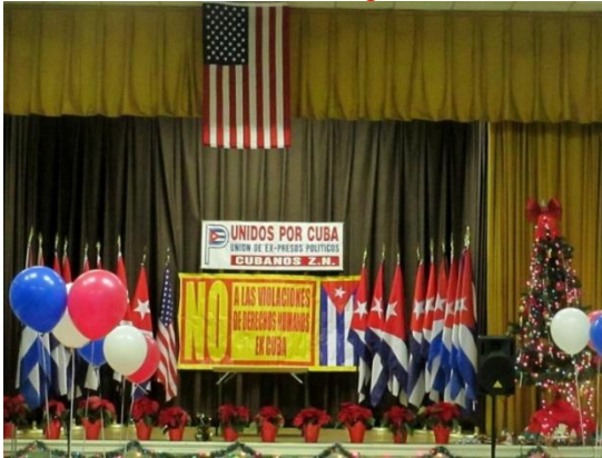
Diciembre 07-2013. Escenario en Comida anual de la UEPPC.