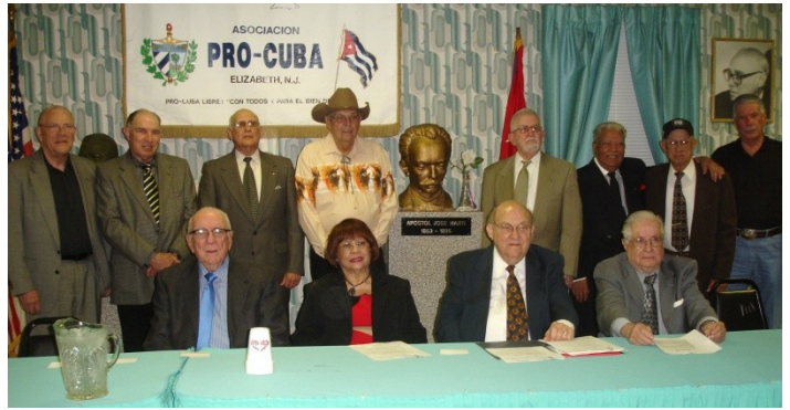
Abril 17 del 2013. Asociación Pro Cuba de Elizabeth, N.J. 7:30. P.M. Acto de recordación del desembarco de Bahía de Cochinos el 17 de abril de 1961.