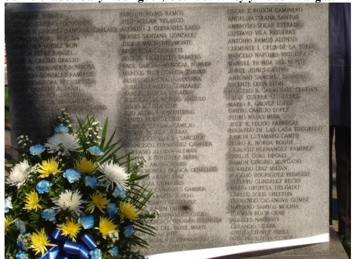
Muro del monumento donde están grabados los nombres de los 104 brigadistas que perdieron la vida en los entrenamientos, las acciones, o en posteriores acontecimientos relacionados.