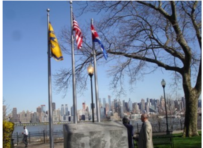
Abril 17 del 2013. Monumento a la Brigada 2506 en West New York, NJ. Boulevard East y 53 St. donde se celebró el acto de recordación a los mártires del desembarco de Bahía de Cochinos.

El 15 de abril de 1961 se produjeron los bombardeos a las pistas y aviones de combates castristas con el fin de inutilizarlos. Dos pilotos de la Brigada murieron ese día y el objetivo se cumplió a medias por la dificultad en abastecer los aviones que debía realizarse en Centroamérica. El 17 de abril se produjo el desembarco; durante tres días los combates fueron fieros y heroicos, la carencia de parque militar y el ataque sin posibilidades de respuestas de la fuerza aérea castrista aniquiló el esfuerzo libertario. Sesenta brigadistas murieron en las acciones y 44 a consecuencia de otros escenarios: entrenamientos, ahogados en una rastra, muertos por hambre en el Golfo de México, asesinados, fusilados y fallecidos en las prisiones.