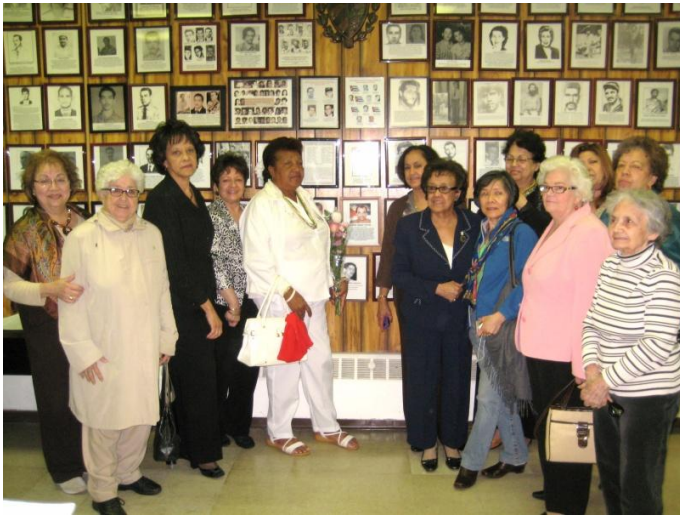
Un bello grupo de damas se retratan junto a Reina Loina Tamayo dejando al centro un espacio para que se pueda apreciar la foto de Orlando Zapata Tamayo en el Mural.