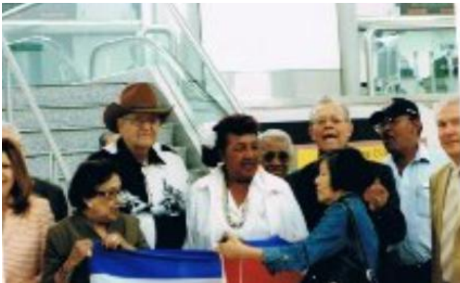
Un grupo de damas de la Asociación Cubano-Americanas y expresos políticos reciben a los visitantes.