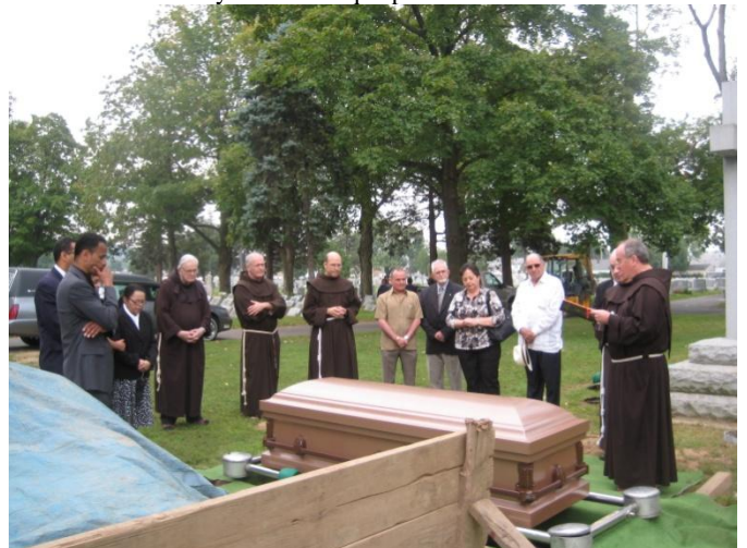
El fraile dirige los rezos finales. El Convento de Paterson, NJ. muy cercano, fue la primera misión franciscana en EE.UU.