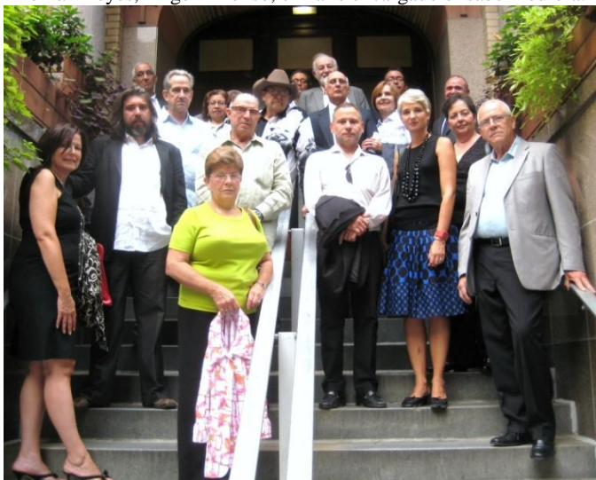
Amistades, ex presos políticos y familiares a la salida de la Iglesia.