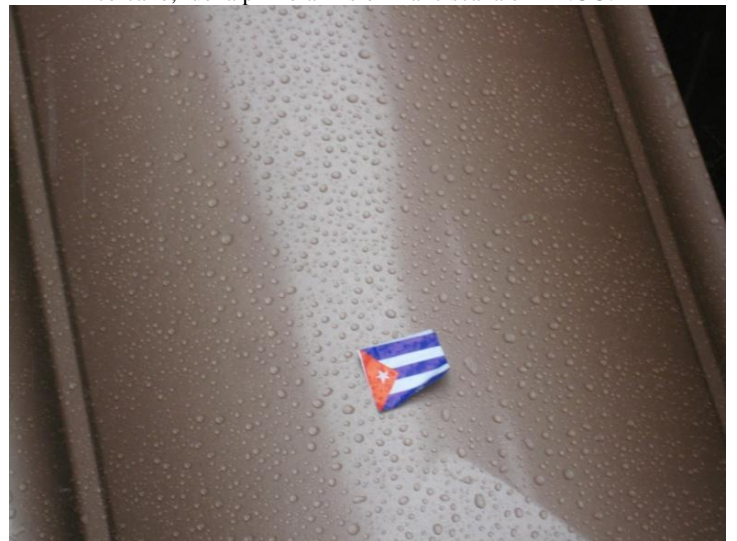
Al momento de bajar el ataúd alguien dejó caer una banderita cubana que el agua pegó. UEPPC Página #2.