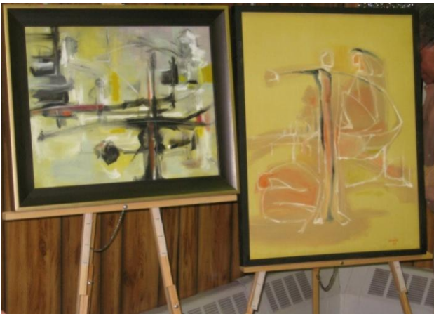
Pinturas del Padre Loredo de su Exposición en el Primer Aniversario de los ataques terroristas de Septiembre 11 del 2001. A la izquierda "Rescue, a la derecha "Why".