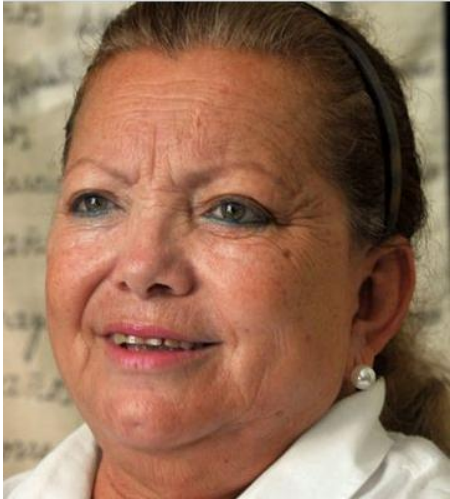
Laura Pollán Toledo + La Habana, Octubre 14 del 2011.

Unidos en el dolor y la indignación, miembros de organizaciones políticas, fraternales y sociales rindieron tributo a Laura Pollán, co-fundadora y líder del movimiento "Damas de Blanco", quien vivió y murió como exponente popular de la resistencia cívica cubana. Su ejemplo es y será un llamado de firmeza y dignidad en todos los sitios donde un cubano viva penando y luchando por una Cuba libre y democrática.