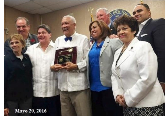
Paquito D'Rivera homenajeado con la Llave de la ciudad de W. York