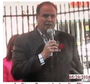
Ino Gómez. Presentador de radio y TV.