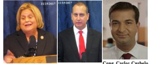
Congresista Ileana Ros-Lehtinen