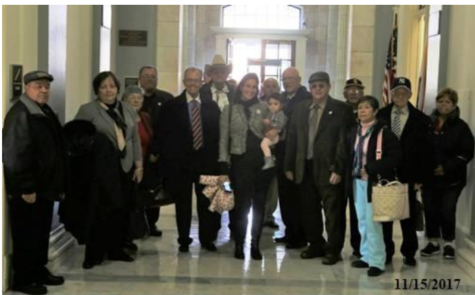
Parte Delegación de New Jersey entrando al Cannon Congress Building de Washington, DC