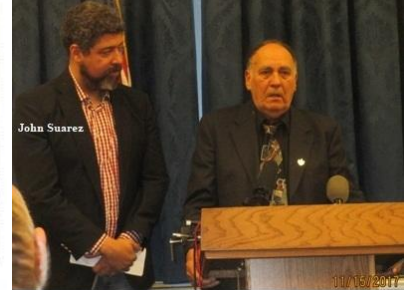
Basilio Guzmán denunció torturas acústicas en las prisiones cubanas