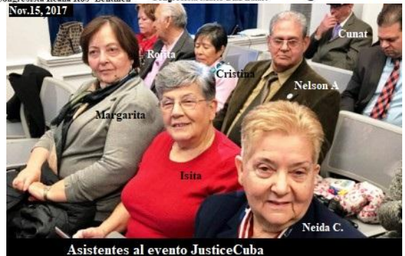
Asistentes al evento JusticeCuba