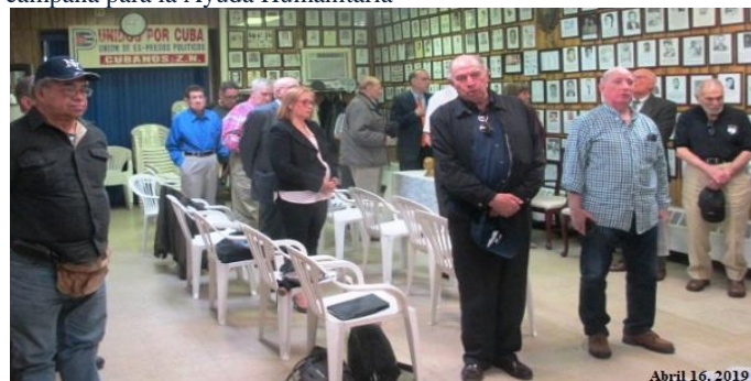
Local de la UEPPC. Abril 16, 2019. Acto homenaje a la Brigada 2506 en el 58 aniversario de su desembarco en Bahía de Cochinos.