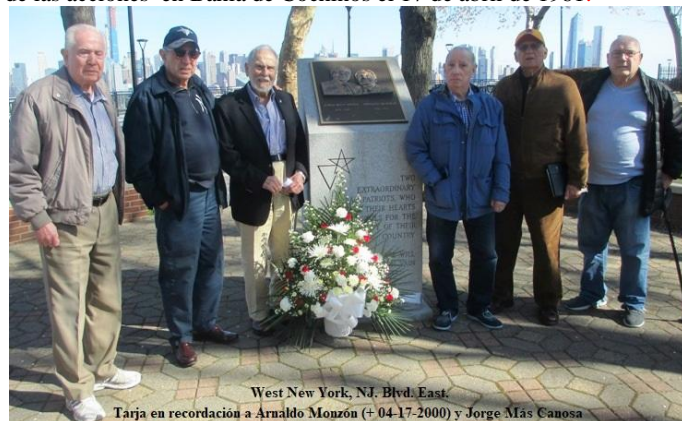
West New York, NJ. Abril 17. Tarja de Arnaldo Monzón, fallecido el 04-17-, 2000 y Jorge Más Canosa.