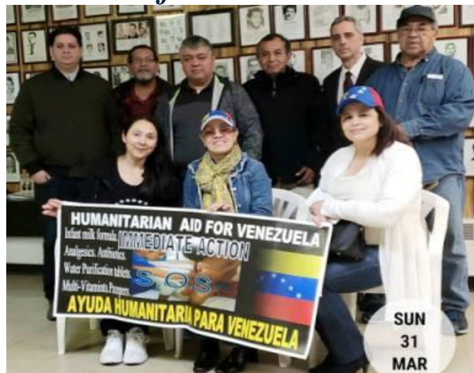
Union City, NJ. Marzo 31, 2019. Local de la UEPPC. Venezolanos amantes de la Libertad y en solidaridad con sus hermanos inician campaña para la Ayuda Humanitaria