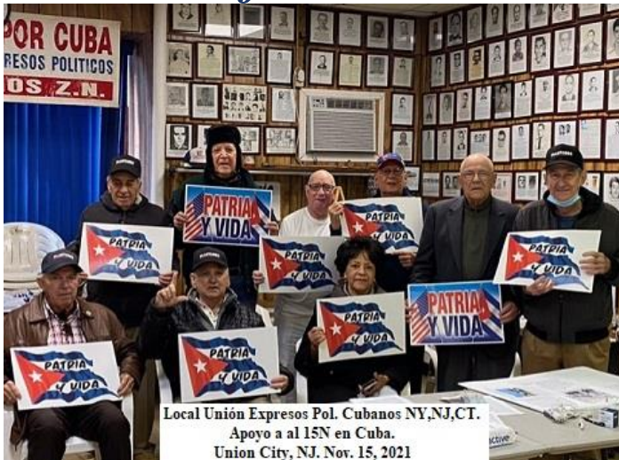
Local Unión Expresos Pol. Cubanos NY,NJ,CT. Apoyo a al 15N en Cuba. Union City, NJ. Nov. 15, 2021