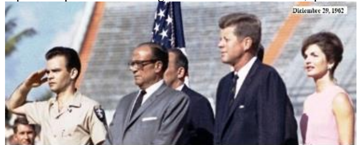
Recibimiento de la Brigada 2506 en el Orange Bowl de Miami, Fl.

Diciembre 29 de 1962 los miembros de la Brigada 2506 son homenajeados por el presidente John F. Kennedy y su esposa Jacqueline en el Orange Bowl Stadium de Miami, quien les