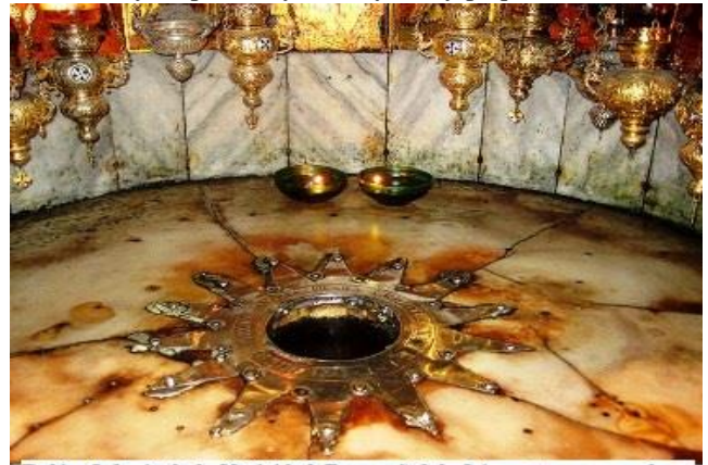
Belén. Iglesia de la Natividad. Esta señal de 14 puntas marca el lugar exacto donde nació Jesús

llenos de juguetes: todo es flor, gala y gozo; todo es pascuas. Es fiesta de ricos y de pobres, y de mayores y pequeños.