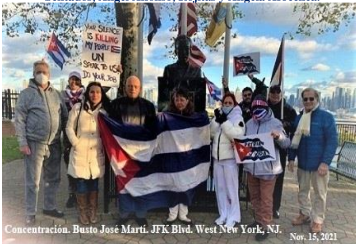
Concentración. Busto José Martí. JFK Blvd. West New York, NJ. Nov. 15, 2021