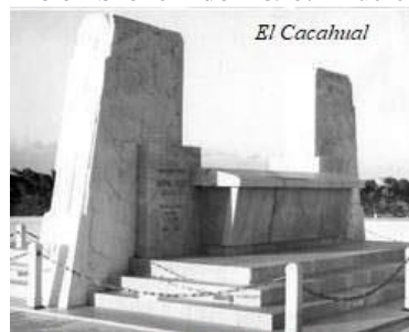
Mausoleo de Antonio Maceo

Diciembre 07 de 1896: Muere en combate el Lugarteniente General del Ejército Libertador Antonio Maceo y Grajales después de haber pasado por el mar la trocha española de Mariel a Majana y sellar con su muerte la campaña de la invasión de Occidente, en la Guerra de Independencia.