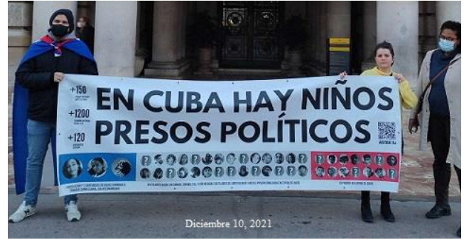
45 menores detenidos después de las protestas del 11 de julio, 2021. (la mayoría han sido liberados, aunque algunos bajo fianza están en espera de juicio, con peticiones fiscales de 4 a 18 años de cárcel).