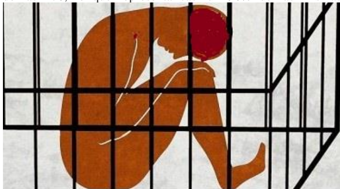
CUBA: presos por peligrosidad predelictiva o tener la intención de manifestarse

Por otra parte, las protestas por motivos políticos y civiles del último mes del año sumaron 170. En la segunda quincena, se reportó un incremento de las protestas por los juicios y condenas a participantes pacíficos del 11J. En cuanto a estas últimas, trascendió que la mayoría fueron protagonizadas por mujeres (152 de las 170, lo que representa casi un 90% de las mismas)