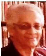
Wilfredo Cárdenas O.

Enero 16, 2022. Fallece en Miami, Fl. el expreso político cubano, Wilfredo Cárdenas Orozco . Natural de Encrucijada, LV. condenado a 20 años de prisión política en la causa 315/1964 de Santa Clara, conocida como la Causa del lápiz. Número 34009 en el Presidio de Isla de Pinos.