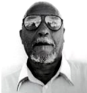
Jesús Cairo Ceballos

Diciembre 22, 2021. Fallece en Miami, Fl. el expreso político cubano, Jesús Cairo Ceballos . Condenado por alzamiento en el Escambray a 30 años de prisión política en la Causa 829/1960 de Las Villas, de los cuales cumplió 27. Número en el Presidio de Isla de Pinos #25979.