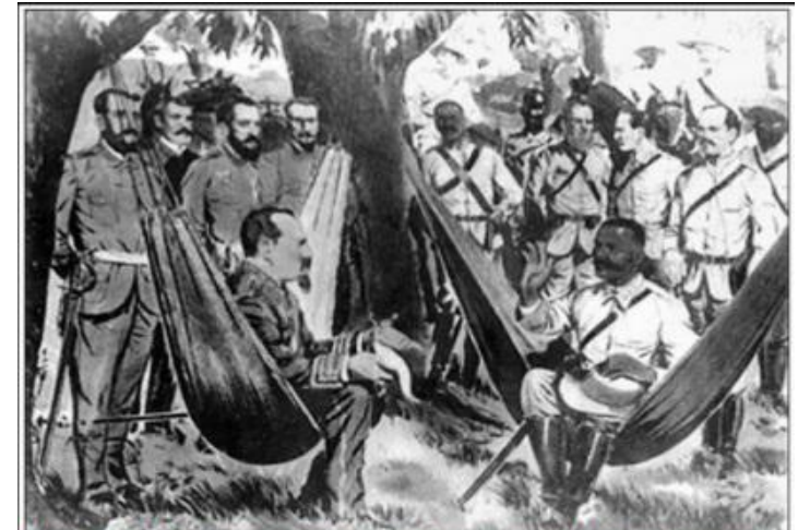
Marzo 15, 1878. Maceo le manifiesta al Gral. español Martínez Campos su decisión de continuar la guerra

15 de 1878. El General Antonio Maceo rechaza el Pacto del