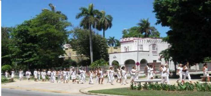
Damas de Blanco en sus caminatas dominicales. Sta. Ave. de Miramar