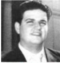
José A. Echeverría

de hegemonía del aspirante a Tirano Fidel Castro. En 1961