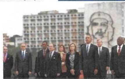
Angulo sugerido por Obama para foto con la Delegación

Fotos que el pueblo cubano esclavizado no perdonará