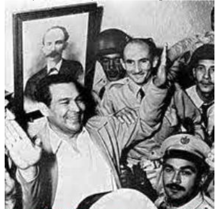
Marzo 10, 1952. Batista en Campamento Columbia

10 de 1952: Inexplicablemente se altera el ritmo constitucional de Cuba al producirse el Golpe de Estado de Fulgencio Batista. Los