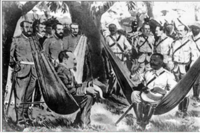
Marzo 15, 1878. Maceo le manifiesta al Gral. español Martínez Campos su decisión de continuar la guerra