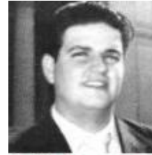
José A. Echeverría

13 de 1957: Se produce en La Habana el Asalto al Palacio Presidencial, la Toma de Radio Reloj y la muerte del presidente de la FEU José Antonio Echeverría Bianchi en un serio intento