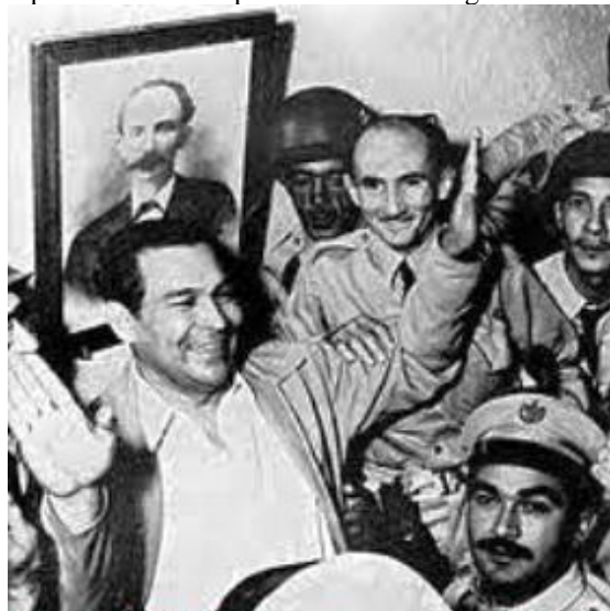
Marzo 10, 1952. Batista en Campamento Columbia

10 de 1952: Inexplicablemente se altera el ritmo constitucional de Cuba al producirse el Golpe de Estado de Fulgencio Batista. Los