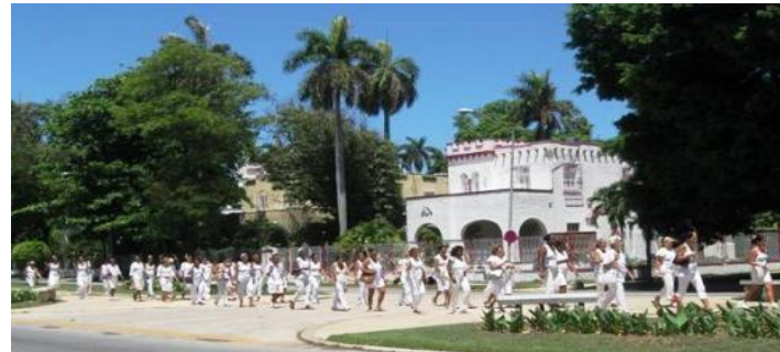
Damas de Blanco en sus caminatas dominicales. 5ta. Ave. de Miramar

asesinada en Guanajay. En 1998 el opositor Wilfredo Martínez Pérez es asesinado en el G2 de Madruga, La Habana. En el 2003 las Damas de Blanco marchan por primera vez y se constituyen como grupo que aboga por la excarcelación de sus familiares detenidos cuando la llamada "primavera negra del 2003" llevando un gladiolo como símbolo de tenacidad, ya que el gladiolo florece de espigas y sus flores persisten. Este movimiento tuvo sus antecedentes en la Europa del Este, conocidos o no por las fundadoras de las Damas de Blanco. En la iglesia St. Nikolai de Leipzig en Alemania del Este donde el pueblo se reunía para servicios por la paz desde 1982 sucedió que en Septiembre 04 de 1989 alrededor de mil quinientas personas después de asistir a los servicios religiosos se daban cita para demostrar caminando por las calles de Leipzig sosteniendo velas y abogando por tener una libertad real en su país. Ellos comenzaron cantando "Nosotros nos quedamos" en referencia a las apertura de las fronteras con Austria que permitía a los germano orientales emigrar a Occidente.