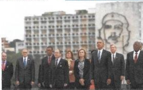
Angulo sugerido por Obama para foto con la Delegación

Fotos que el pueblo cubano esclavizado no perdonará