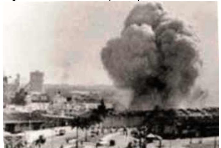
Explosión en el puerto de La Habana del vapor Le Coubre

04 de 1960: A las 3:10 P.M. explota en el puerto de La Habana el carguero francés "La Coubre" que transportaba 76 toneladas de