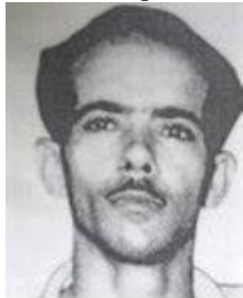
Israel Rodríguez Lima

11 de 1963: Israel Rodríguez Lima y tres más son fusilados en La Cabaña por ir a Cuba a buscar a sus familiares. Israel había estado alzado en la Sierra del Escambray pero logró salir para EE.UU.