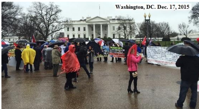
Demonstration against ease relations with Cuba. First anniversary

En 2014 Raúl Castro y Obama anuncian el inicio del proceso para el restablecimiento de relaciones bilaterales acordadas en una supuesta conversación telefónica dos días antes de culminar seis meses de ocultos intercambios entre funcionarios de ambos países. En 2015 exilados cubanos de varias lugares de los EE.UU. se dan cita en el parque Lafayette frente a la Casa Blanca en Washington, DC. para demostrar su rechazo al restablecimiento de relaciones con Cuba y denunciar que las concesiones unilaterales por parte del Presidente Obama sólo han resultado en que el régimen cubano había aumentado la represión contra la oposición.