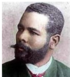
Antonio Maceo y Grajales