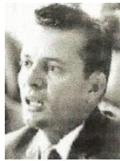
Pedro L. Díaz Lanz

06 de 1959: Pedro Luís Díaz Lanz, primer jefe de la FAR (Fuerza Aérea Revolucionaria) se escapa en una lancha hacia EE.UU. En 1960 el gobierno "revolucionario" de Cuba