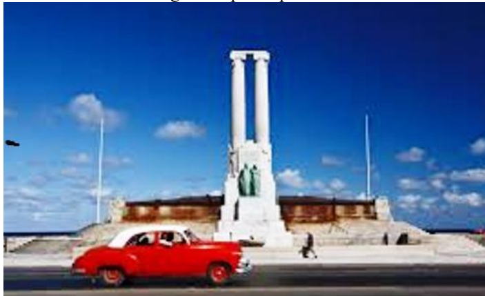
Monumento a las víctimas del acorazado Maine. Malecón habanero

18 de 1960: El régimen de Castro estataliza las revistas Carteles, Vanidades y Bohemia. En 1961 el águila imperial que coronaba las dos columnas del monumento al Maine en el malecón habanero fue decapitada por el gobierno de Fidel Castro, que ordenó colocar en el lugar una placa que reza: "A las víctimas de