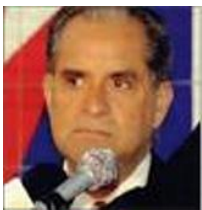
Jorge Mas Canosa