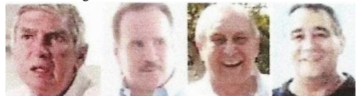
Luis Posada Carriles Pedro Remón Guillermo Novo Gaspar Jiménez