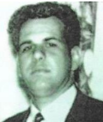
Luis Álvarez Ríos

mártir del Plan de Trabajos Forzados para Presos Políticos es asesinado a bayonetazos en el Edificio #6 del Presidio de Isla de Pinos por el Sargento de Orden Interior, Porfirio