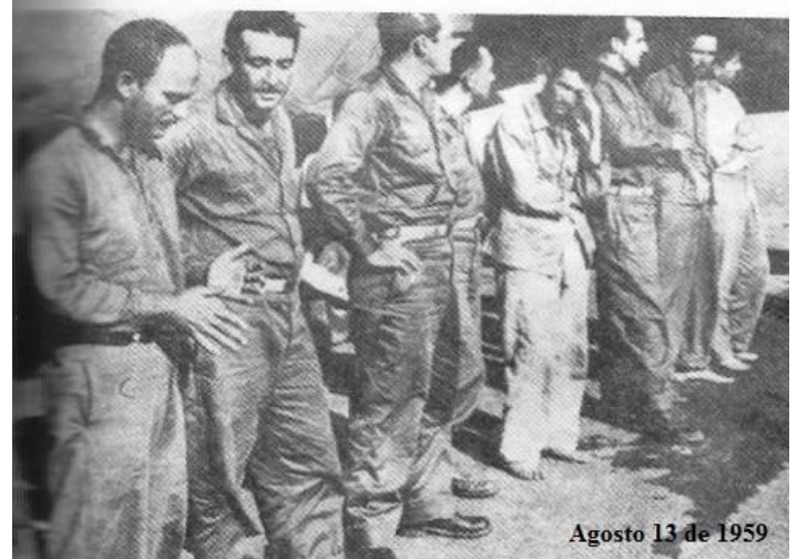
Parte de los exilados cubanos en Santo Domingo que desembarcan en Trinidad, LV.

13 de 1959: Aterriza en la ciudad de Trinidad, LV. un