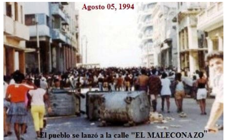
Agosto 05, 1994