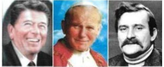
Ronald Reagan 40 Presid.

y obligó al régimen conceder a los trabajadores el derecho a organizar su propio sindicato independiente. La receta de los sindicatos independientes se extendió por otros sectores de trabajadores y llevó a pesar de las concesiones obtenidas