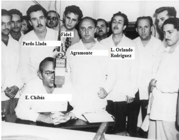
Chibás transmitiendo en CMQ rodeado de varios que luego instalaron la Tiranía.