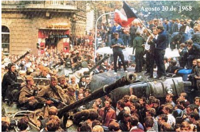
En medio de la confusión los militares se mezclan con la oposición

en la noche del 20 al 21 de agosto de 1968 y aplastaron la insurrección popular. Más de 100 personas perdieron la vida, y los líderes comunistas, incluyendo a Alexander Dubcek, fueron detenidos y llevados a Moscú. A pesar de la feroz resistencia, un protocolo de acción se publicó pocos días después de la invasión que prohibió todos los partidos y organizaciones que "violaran los principios socialistas".