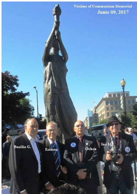
Victims of Communism Memorial Junio 09, 2017