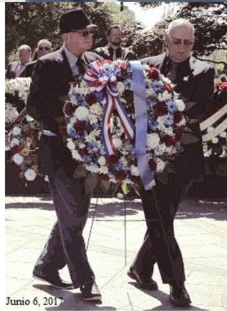
Junio 6, 2017