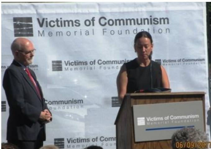
Presentación de la Medalla Truman-Reagan de la Libertad a Dr. Mart Laar ex-Primer Ministro de Estonia recibida por la Embajadora de Estonia.