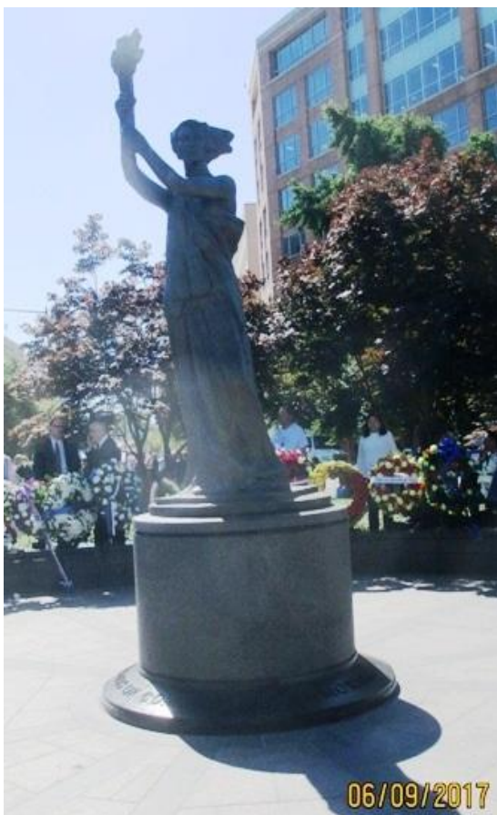
Réplica de la estatua de Libertad, Tianamen 1989