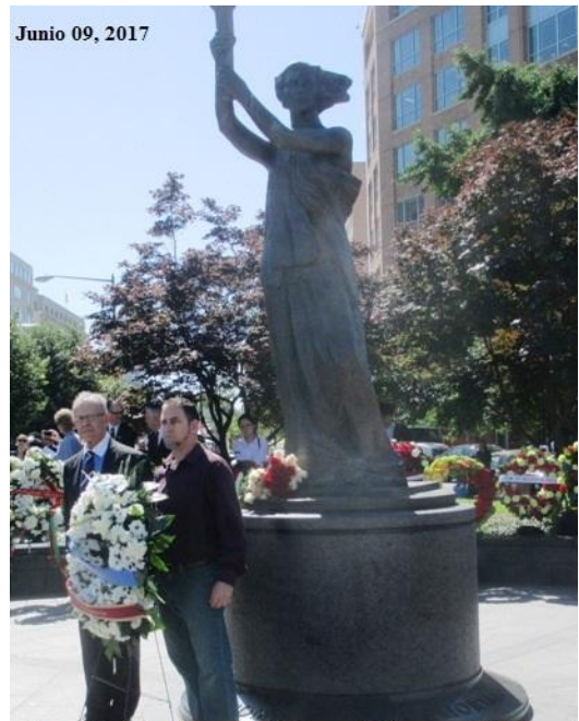
Junio 09, 2017