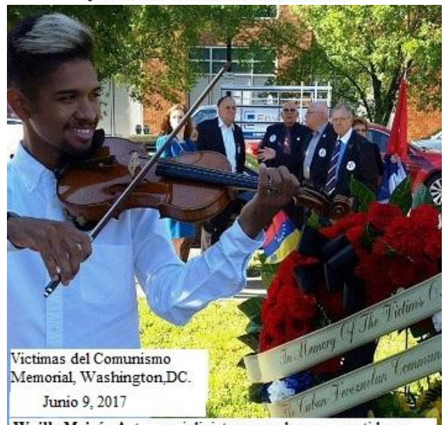
Victimas del Comunismo Memorial, Washington, DC. Junio 9, 2017