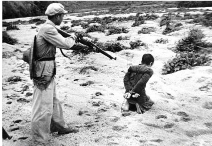
Revolución Cultural China: Condenar a todos cuyos actos se aparte de la ortodoxia revolucionaria.

Octubre 11 de 1976. Fin oficial de la Revolución