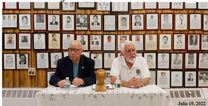
Julio 19, 2022