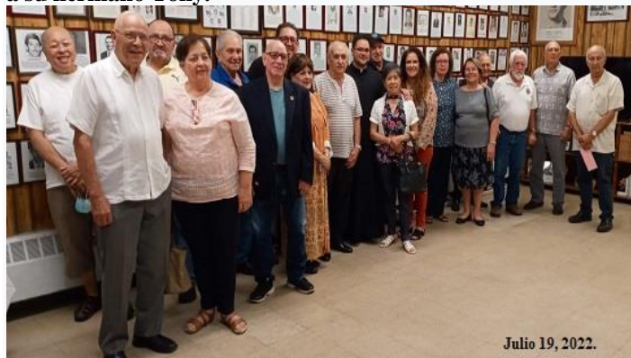
Julio 19, 2022.