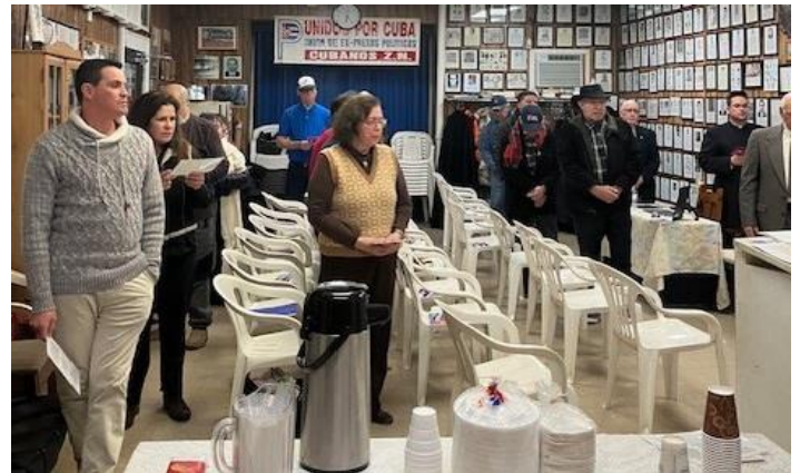
Asistentes de pie para los himnos Nacionales de EE.UU. y Cuba.

cubana y su compromiso con la causa patria. Valdés destacó la importancia de la fe, la unidad y la esperanza en el camino hacia una Cuba libre. Subrayando que la unidad no significa uniformidad, sino la coexistencia armoniosa de voces y métodos diversos, especialmente para los que viven en tierras donde el Padre Varela y José Martí pasaron la mayor parte de su vida.