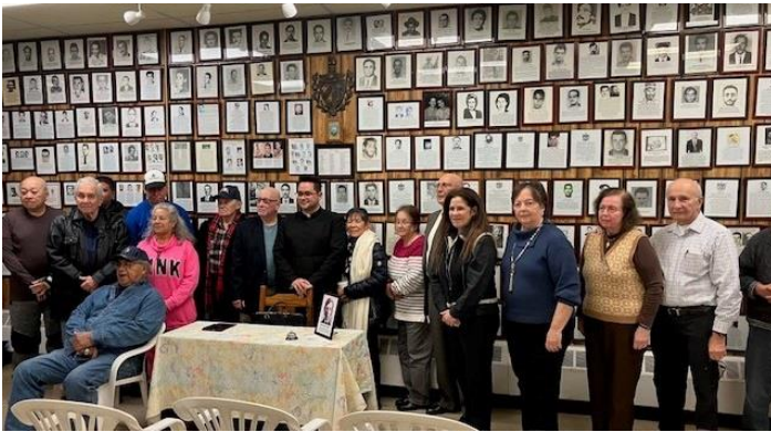
Foto al final de la conferencia