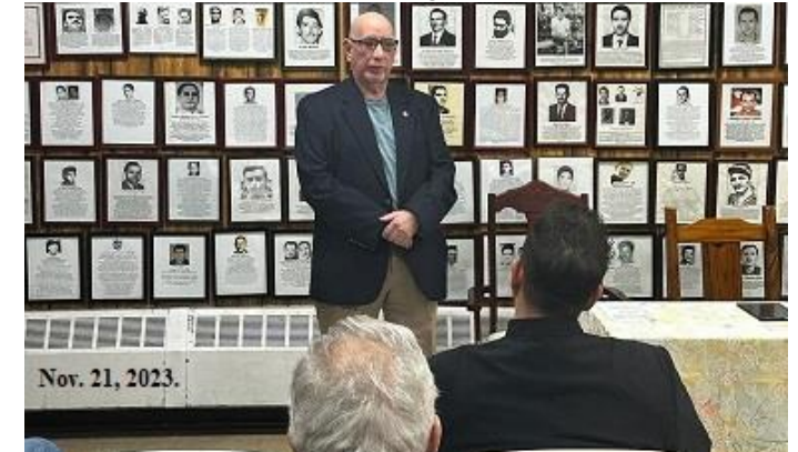
El presidente de la UEPPC, Evaristo Sotolongo en la bienvenida