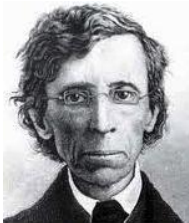
Padre Félix Varela

Un hombre de Dios y de la Patria, quien se adelantó a su tiempo.