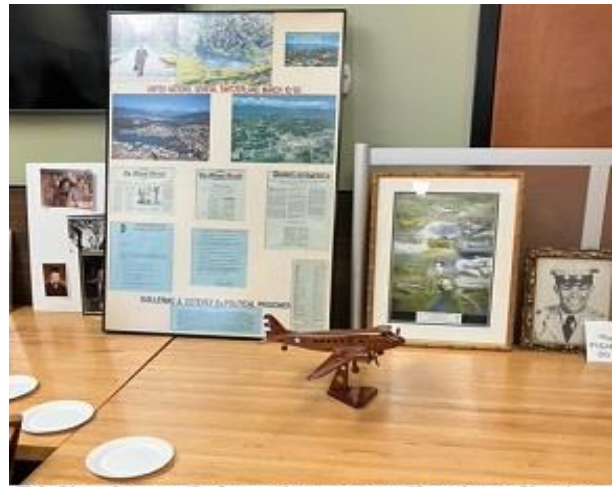
Réplica de uno de los aviones que piloteó y reliquias

Old pilots never die, they just fly higher