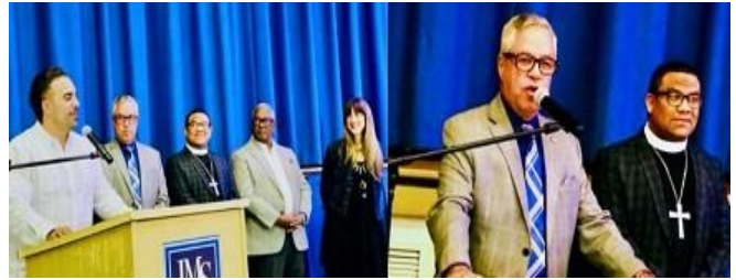
Mayo 20, 2024. José Martí STEM Academy. Cena celebración.