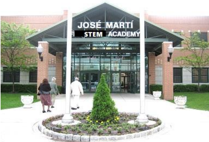
José Martí STEM Academy. Escuela y biblioteca. 1800 Summit Ave, Union City, NJ 07087