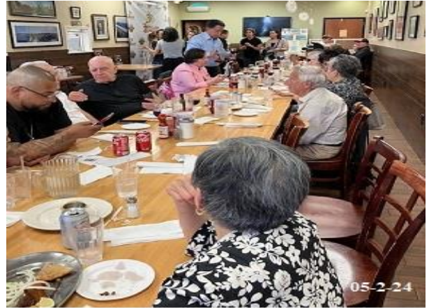
Vista parcial de los asistentes.