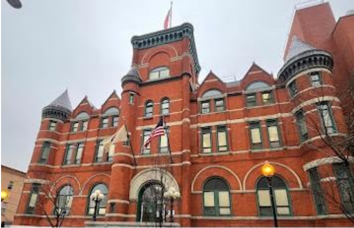
Union City, NJ. City Hall Building

La ciudad de Union City, NJ. celebra el 20 de mayo 1902 con dos actos: Iza de la bandera cubana en parque Internacional frente al City Hall y cena de celebración en la los salones de José Martí STEM Academy.