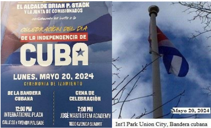
Int'l Park Union City, Bandera cubana