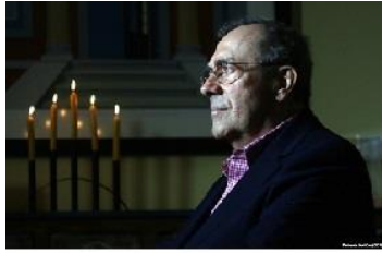
CARLOS ALBERTO MONTANER

despedido en mayo en un emotivo artículo en el que hablaba de la seria condición neurodegenerativa que padecía. Montaner escogió morir en sus propios términos, tal como lo permite la ley de Eutanasia española, y con el "apoyo incondicional" de su familia. El autor, cuya vida se iba apagando poco a poco a consecuencias de una parálisis supranuclear progresiva, comenzó a escribir un artículo póstumo "Cuando usted lea este artículo yo estaré muerto" en Miami a inicios de 2022, y lo concluyó dictado; la enfermedad no le permitía escribir, conversar bien, ni leer más allá de los titulares, había dicho el periodista en "Mi última columna", un adiós anticipado.