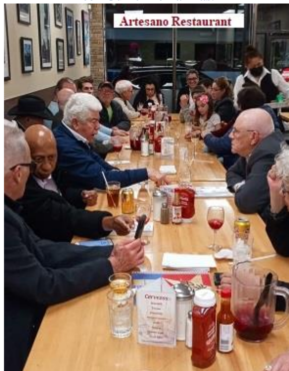
Después del encuentro la acostumbrada cena en "El Artesano" Union City, NJ. Suplemento "Clarinateda" abril 2, 2022.