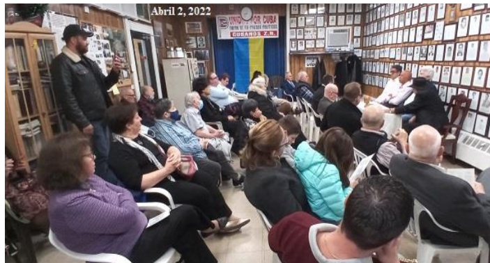
Vista parcial de los asistentes.