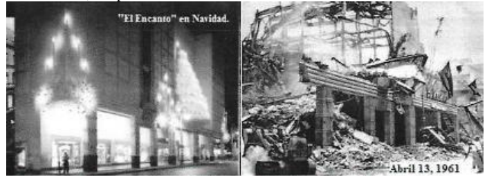
Tienda por Departamentos "El Encanto" Galiano y San Rafael. La Habana

en el hecho; el pueblo bautizó la instalación como "La Gran Estafa"