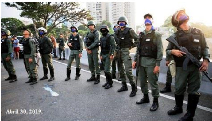
Guardias Nacionales identificados con la cinta azul, apoyan la rebelión