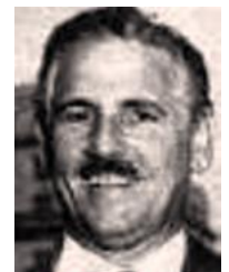
Dr. Carlos Prío