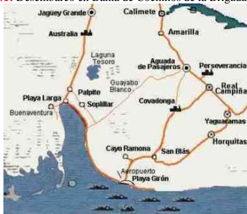
Abril 17, 1961. Mapa de Bahía de Cochinos