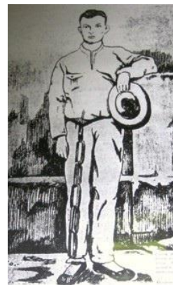
José Martí en traje de preso

05 de 1870: José Julián Martí y Pérez, el Apóstol de la Independencia de Cuba, es enviado a trabajos forzados en las Canteras de San Lázaro con el número 113 y grillete en el tobillo en la Primera Galera de Blancos. Por ello este día ha sido escogido para celebrar el Día del Preso Político Cubano. El 04 de octubre de 1869 había sido condenado por un delito de infidencia a seis años y recluido en la Cárcel Departamental de La Habana.