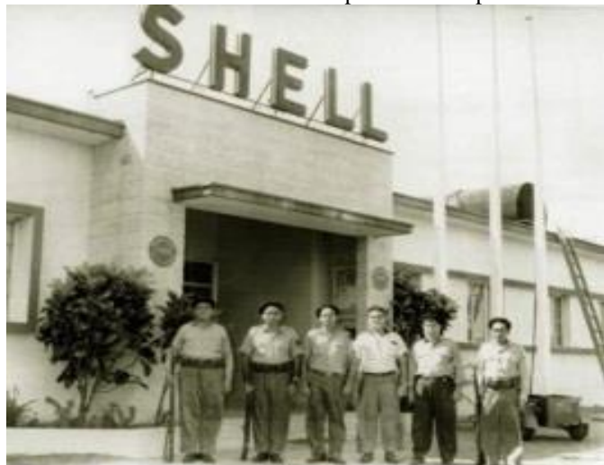
Julio 01, 1960. Milicianos interventores

La Habana las instalaciones de la ESSO y la anglo-holandesa Shell. El gobierno de los EE, UU. respondió eliminando la cuota azucarera a precios preferenciales.