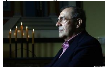
CARLOS ALBERTO MONTANER

propios términos, tal como lo permite la ley de Eutanasia española, y con el "apoyo incondicional" de su familia. El autor, cuya vida se iba apagando poco a poco a consecuencias de una parálisis supranuclear progresiva, comenzó a escribir un artículo póstumo "Cuando usted lea este artículo yo estaré muerto" en Miami a inicios de 2022, y lo concluyó al dictado. La enfermedad no le permitía ya escribir, ni "conversar bien", ni "leer más allá de los titulares", había dicho el periodista en "Mi última columna", un adiós anticipado.