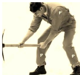
Plan de Trabajos Forzados "Camilo Cienfuegos"