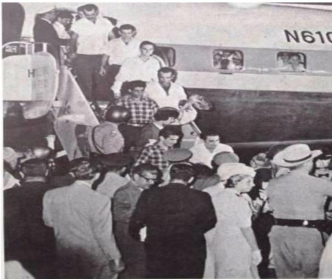
... El primer vuelo de la libertad descendió en la pista de la base aérea de Homestead, en La Florida, el 23 de diciembre a las 6:07 de la tarde. Se iniciaba así el rescate de los 1,113 prisioneros de Playa Girón ...