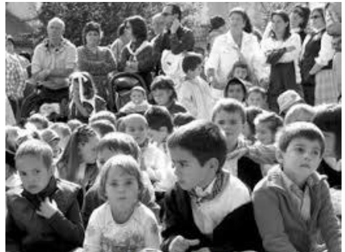
Niños de la operación "Peter Pan"