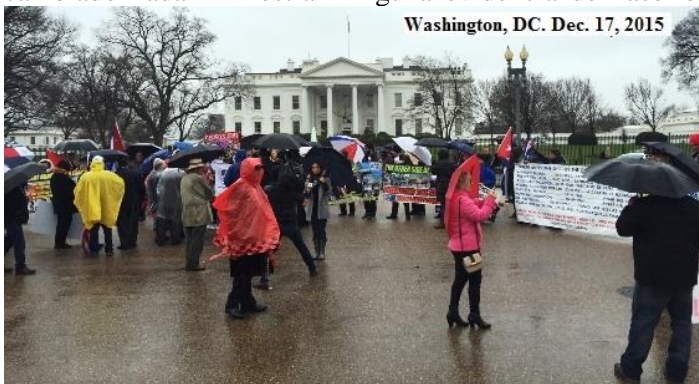
Demonstration against ease relations with Cuba. First anniversary

En 2015 exilados cubanos procedentes de varios lugares de los EE.UU. y Puerto Rico se dan cita en el parque Lafayette frente a la Casa Blanca en Washington, DC. para demostrar su rechazo al restablecimiento de relaciones diplomáticas con Cuba ocurridas un año atrás y denunciar que las concesiones unilaterales por parte del Presidente Barack H. Obama sólo habían resultado en que el régimen cubano hubiera aumentado la represión contra la oposición, manteniéndose fiel a sus postulados totalitarios sin haber cambiado nada ni mostrar ninguna evidencia de hacerlo.