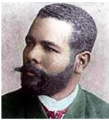
Antonio Maceo y Grajales

07 de 1896: Muere en combate el Lugarteniente General del Ejército Libertador Antonio Maceo y Grajales después de haber pasado por el mar la trocha española de Mariel a Majana y sellar con su muerte la campaña de la invasión de Occidente, en la Guerra de Independencia. En