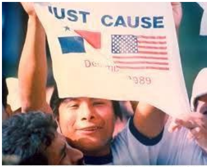
Invasión a Panamá por EE.UU. Dic. 20, 1989

H. W. Bush, autorizó con resultados inmediatos la invasión a Panamá en la operación militar denominada "Causa Justa", por los siguientes motivos: