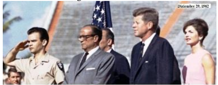
Recibimiento de la Brigada 2506 en el Orange Bowl de Miami, Fl.

bandera de la Brigada 2506 en una Habana Libre.